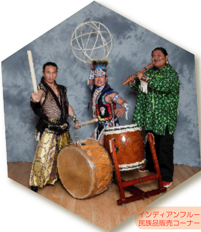
インディアンフルートの展示とホピ族の民族品販売コーナーを設置します。

“和のこころ”をテーマに、“譲り合い”“助け合い”といった、日本人とホピ族の共通点を見出していきます。